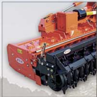
REGOLAZIONE RULLO LATERALE REGULATION SIDE ROLLER RÉGULATION ROULEAU LATÉRAL SEITLICHE REGELUNG WALZE

Le caratteristiche tecniche e le immagini possono subire variazioni senza obbligo di preavviso e responsabilità.