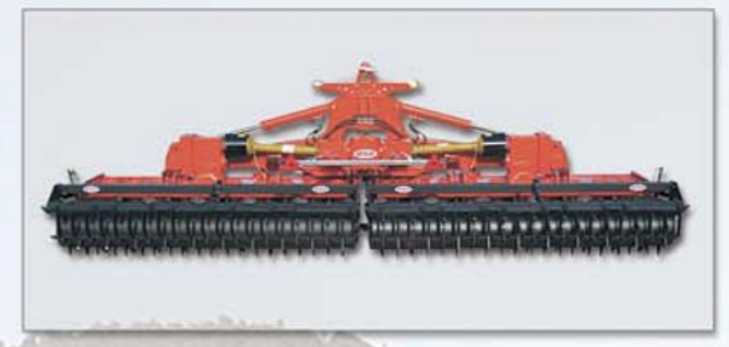
VISTA POSTERIORE BACK SIGHT VUE ARRIÈRE HINTERANSICHT

Specifications and/or designs are subject to change without notice or obligation.