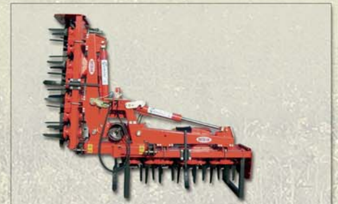
CHIUSURA IDRAULICA HYDRAULIC CLOSURE FERMETURE HYDRAULIQUE HYDRAULISCHE SCHLIEBUNG

HERSE ROTATIVE REPLIABLE MULTIVITESSES SÉRIES GEMINI POUR TRACTEURS ENTRE 80 ET 280 CV (59 - 206 KW) Cette herse rotative est utilisée pour travailler le sol afin de préparer et améliorer les terrains pour l'ensemencement dans le domaine de l'Agriculture.