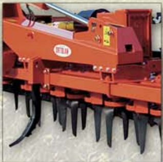
ROMPITRACCIA SUBSOILER SOUS-SOLEUSE SPUR BRECHER